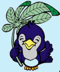
県民の日マスコット「ルリちゃん」