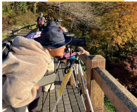
途中でのぞかせて頂いた 望遠鏡