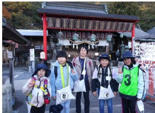
太平山神社前にて