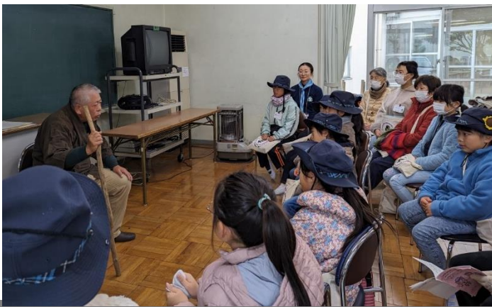
大中寺の七不思議