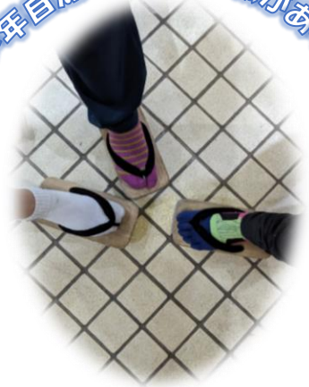
マスコットのゲッターケン入りの サコッシュ!