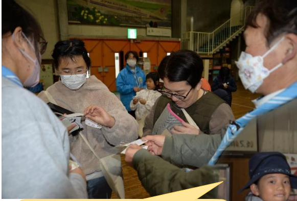
名刺交換:リーダーも *「私は8枚集まったよ！」