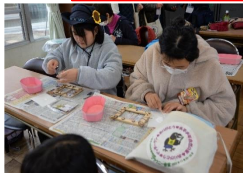
ジュニア6年生の 実行委員