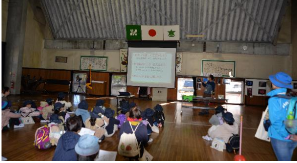
入所式後のオリエンテーリング