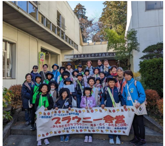
これから太平山の自然観察ゲームに出発！